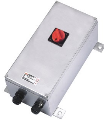
专利产品，仿冒必究